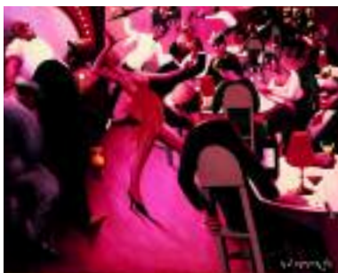
Archibald J. Motley, Jr. (1891– 1981) Saturday Night , 1935 Oil on canvas, 81.3 x 101.6 cm Howard University Gallery of Art, Washington, D.C. GALLERY 209

What clues tell you that this scene was painted more than a century ago? What changes would you expect to see if you were able to visit this spot today?