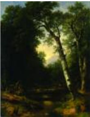
Asher B. Durand (1796–1886) A Creek in the Woods , 1865 Oil on canvas, 101.6 x 81.9 cm Museo Thyssen-Bornemisza, Madrid