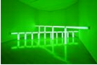
Dan Flavin (1933–1996) greens crossing greens (to Piet Mondrian who lacked green) , 1966

Green fluorescent light 2 and 4 feet fixtures (61 and 122 cm); first section: 48 inches (122 cm) high, 240 inches (610 cm) wide; second section: 24 inches (61 cm) high, 263 3/4 (670 cm) wide. Solomon R. Guggenheim Museum, New York