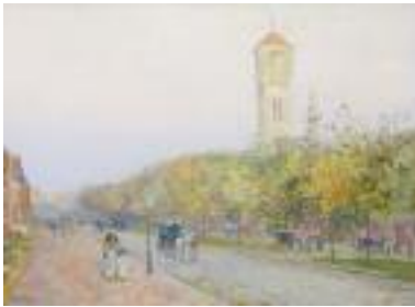
Frederick Childe Hassam (1859–1935) Commonwealth Avenue, Boston , ca. 1892 Oil on canvas, 56.5 x 76.8 cm Terra Foundation for American Art, Chicago, Daniel J. Terra Collection GALLERY 207

Describe the relationship between man and nature that is depicted in this painting. Do you think this has changed over the centuries or remained constant? Explain your response.