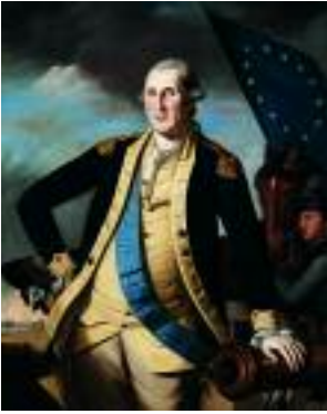
Charles Willson Peale (1741–1827) George Washington , ca. 1780–82 Oil on canvas, 127 x 101.6 cm Walton Family Foundation Collection, Bentonville (Arkansas)

Les paysages, qui affectionnent les territoires sauvages en leur état naturel et la vastitude d'un continent vierge apparemment sans bornes, symbolisent le potentiel de grandeur de la nation et s'inspirent des théories philosophiques et des doctrines politiques en cours. Le Transcendentalisme, un mouvement philosophique (la croyance que Dieu est inhérent à la nature et à l'homme) qui a dominé la vie intellectuelle nord-américaine de 1836 à 1860 environ, s'est traduit par de multiples peintures de paysage. Vers le milieu du XIXe siècle, l'idée du Destin Manifeste atteint son apogée. La croyance en une expansion vers l'Ouest bénéficiant de la protection divine qui légitime, pour