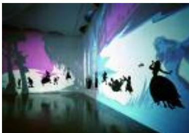
Kara Walker (1969-) Insurrection! (Our Tools Were Rudimentary, Yet We Pressed On) , 2000 (detail) Cut paper silhouettes and light projections, dimensions vary with installation. Solomon R. Guggenheim Museum, New York, purchased with funds contributed by the International Director's Council and Executive Committee Members

Some of Walker's narrative is easy to interpret, but some is quite ambiguous. Have a class discussion that considers the aspects of her work that are easily deciphered, as well as those that are more difficult to understand. Do you think this ambiguity adds or detracts from her work? Discuss.